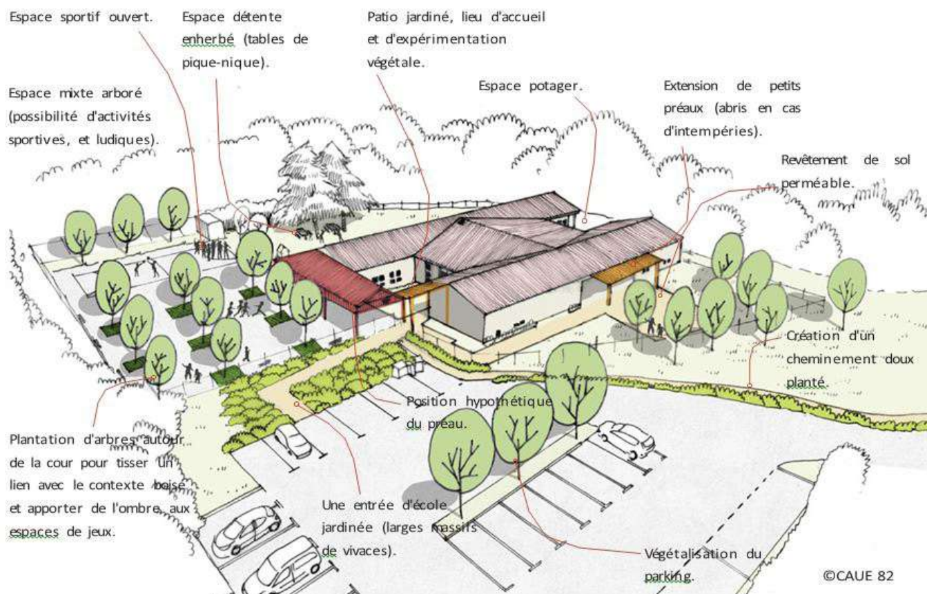
L'un des croquis d'ébauche du projet tel que préconisé par le CAUE 82

Nous vous tiendrons bien évidemment au courant de l'évolution de ce projet.