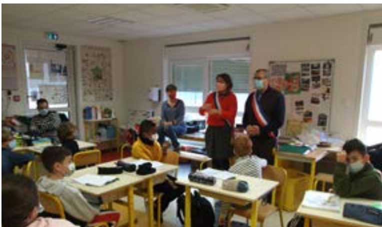
La députée Valérie Rabault (ici aux côtés du maire) venue rendre visite aux écoliers léojacois engagés dans un concours citoyen.

Désormais, tout le chemin de la mairie est limité à 50 km/h, de bas en haut et de haut en bas. Respectons la signalisation et nos concitoyens, enfants, piétons, riverains.