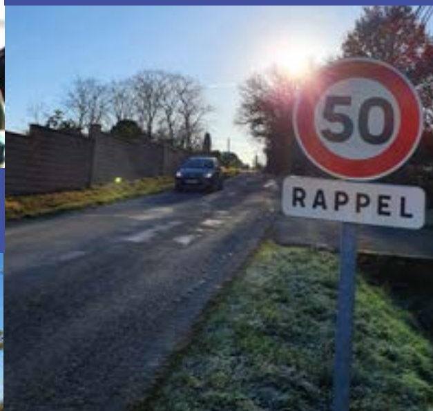
Une vue de l'école lorsque les travaux seront achevés avec le préau. Ce sera fait pour la rentrée de septembre prochain.

Désormais, tout le chemin de la mairie est limité à 50 km/h, de bas en haut et de haut en bas. Respectons la signalisation et nos concitoyens, enfants, piétons, riverains.