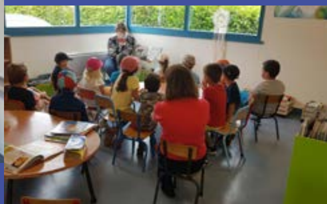
Les enfants de l'école en visite à la bibliothèque pour découvrir les nombreux volumes disponibles.