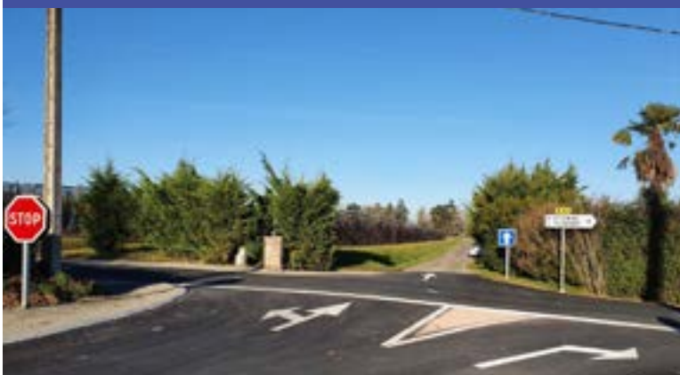
Depuis cet été, la sécurisation du carrefour de la route de Saint-Etienne et de Génébrières est effective avec la mise en place d'un sens unique et un débouché sur la RD.70 déplacé pour une meilleure visibilité.