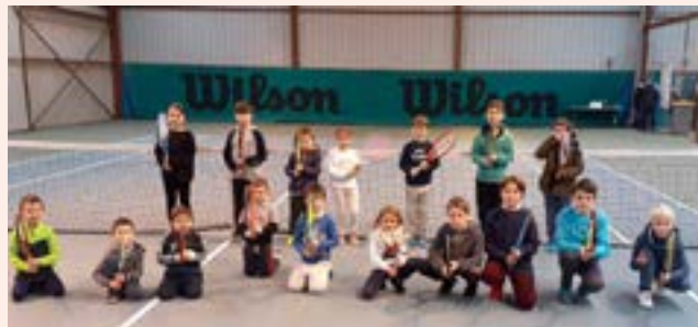
Un mercredi après midi sur les cours du Rastely