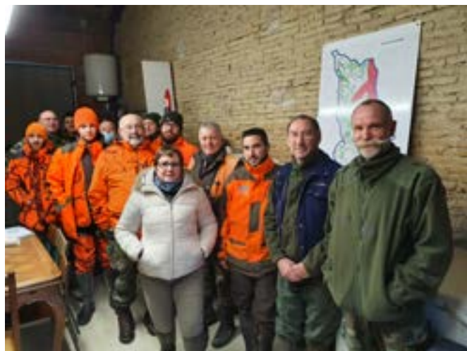
Les chasseurs léojacois

ACCA. 55 lotissement Les Vergnoux. 82230 Léojac