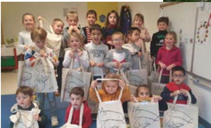
Le père Noël de la mairie est passé avant Noël et a remis des livres aux écoliers.