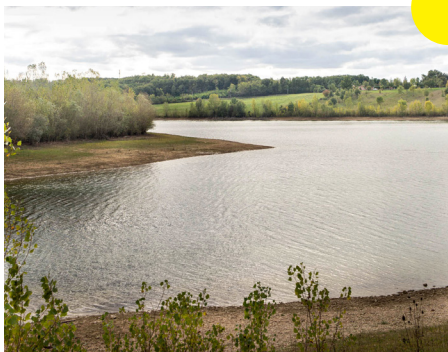
Lac du Tordre