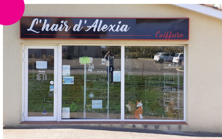
Salon de coiffure