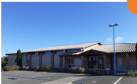
Salle des fêtes