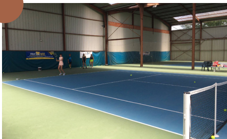
Tennis Club Léojacois